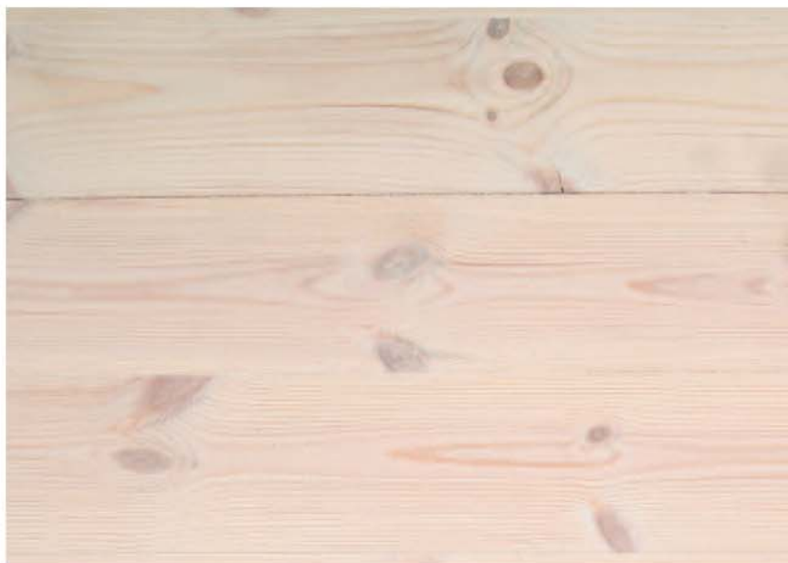
Lut- og oljebehandlet gulv.

Disse behandlingene tilfører treet nokså mye vann, slik at det vil svulle. Etter tørking går svellingen tilbake, men blir den hindret, så vil treet "stukes". Ved senere tørking krymper det da "forbi" utgangsdimensjonen. For gulvbord, særlig om de er brede, kan det resultere i litt større sprekker mellom bordene enn man ellers ville fått.