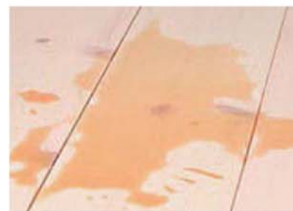
Såpevasking av gulv.

Dersom gulvet brukes slik at man må skure kraftig og ofte, bør man heller bruke en behandling som gir beskyttelse, ellers vil treet ha en tendens til å bli oppfliset med tiden.